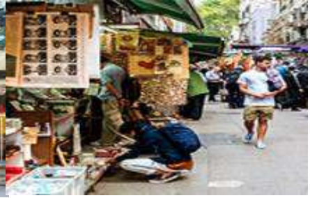
Upper Lascar Row