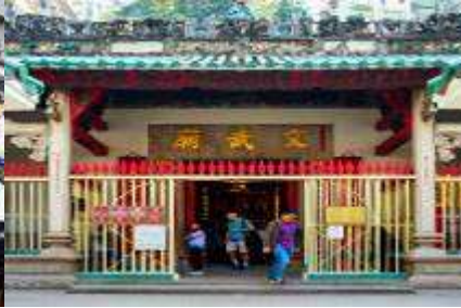
Man Mo Temple