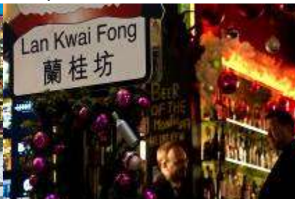
Lan Kwai Fong