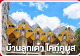
บ้านลูกเต่า โคกคูมูส