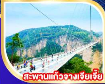
สะพานแก้วจางเจียเจีย