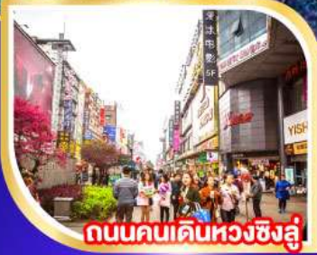
ถนนคนเดินหวงซิงลู่